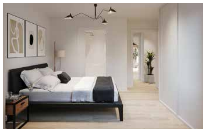
(*) Exemples d'acabats de la promoció